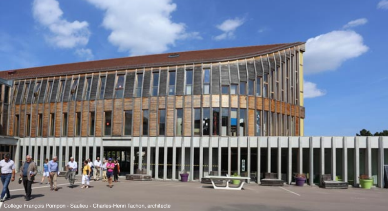
Collège François Pompon - Saulieu - Charles-Henri Tachon, architecte